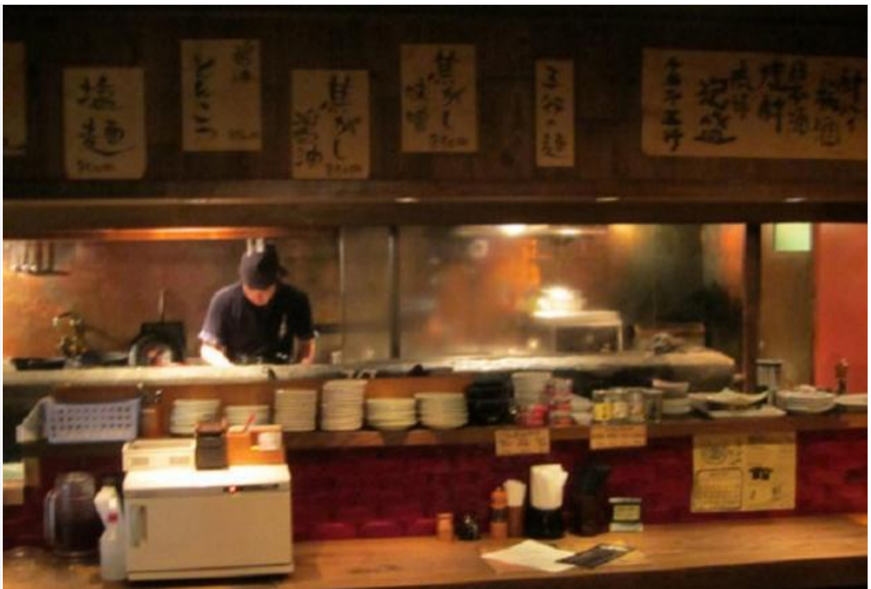
Un restaurant de ramen dans Nishi-Azabu, un district de Tokyo.