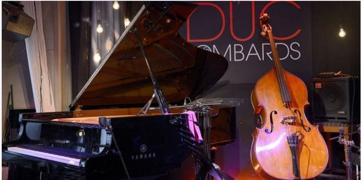
Le Duc des Lombards, point de rendez-vous des amoureux de Jazz.