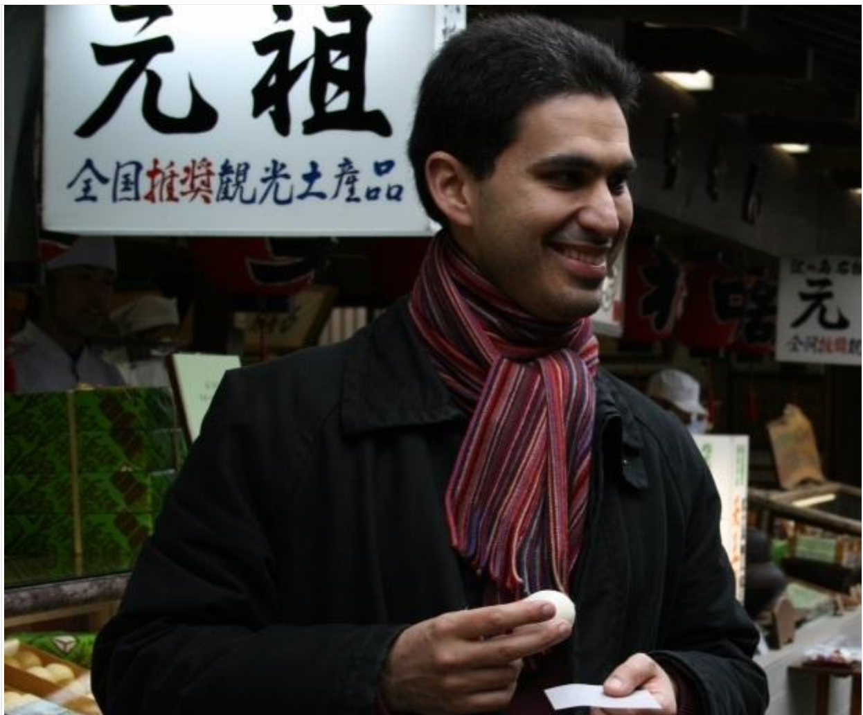
A Enoshima, petite île du sud du Japon.